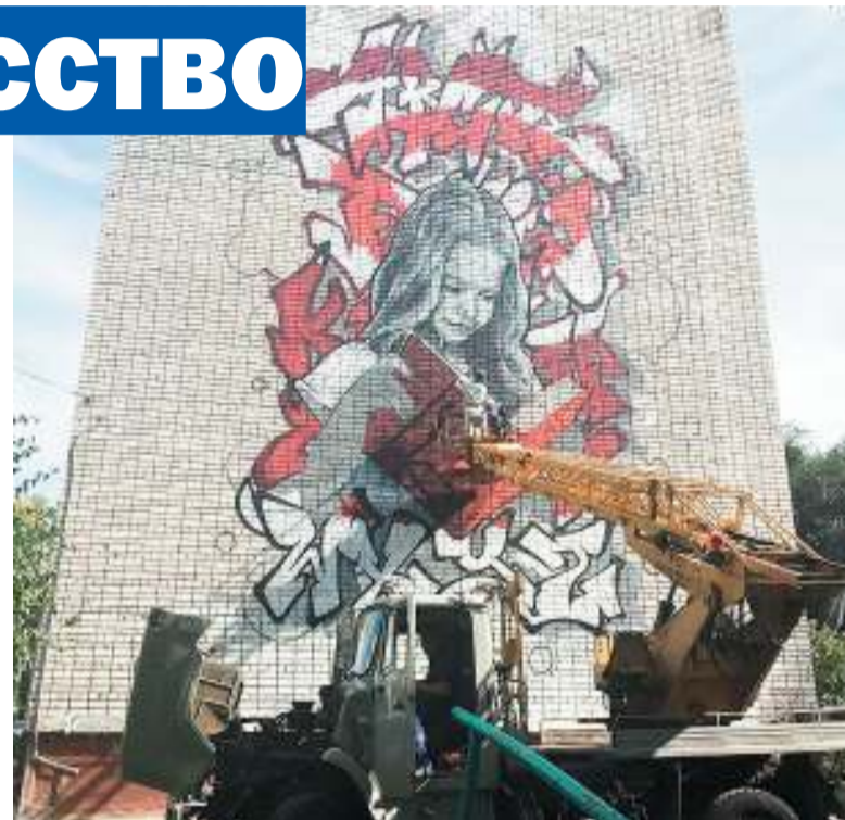
Для нанесения граффити на фасад дома №12а на проезде Полбина пришлось использовать автовышку