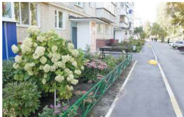
Обновили и входные группы - вместе с реконструкцией двора, и дом 1975 года выглядит теперь не хуже (даже лучше) иной новостройки

● «Победитель несанкционированных свалок» (решение проблем с мусором). Критерии оценки: получение опыта и результат взаимодействия с региональным оператором по ликвидации несанкционированных свалок; вовлечение волонтеров от населения и организаций в расчистку территорий общего пользования на берегах рек, озер, прудов, в лесах - мест проведения пикников и отдыха на природе; объем и количество вывезенных несанкционированных свалок; идеи и пропаганда бережного отношения к природе и окружающей среде.