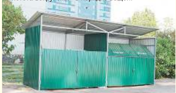
Хороший пример для подражания - контейнерная площадка на ул. Карбышева: предусмотрены отдельные секции для макулатуры и пластика, причем вторсырье жители сдают за деньги, которые затем направляют на благоустройство двора

Раньше у нас и квартиры не запирались! Многие еще помнят времена, когда ключи клали под коврик у входной двери. А потом не то что в квартиру, на входе в подъезды начали замки вешать. Мы не беремся рассуждать, насколько это хорошо или плохо, просто констатируем, что время другое. Рано или поздно мы также придем к тому, что устраивать свалку на площадке станет дурным тоном, а закрытые контейнеры и чистота вокруг них - в порядке вещей.