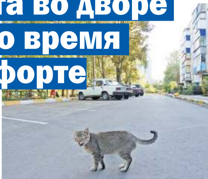
Хозяин двора охраняет его от непрошенных гостей: шипит на чужаков

- Да, я живу здесь с самого первого дня, как заселился в 1975 году. И никогда тут ничего не делалось. Это сейчас мы начали следить,