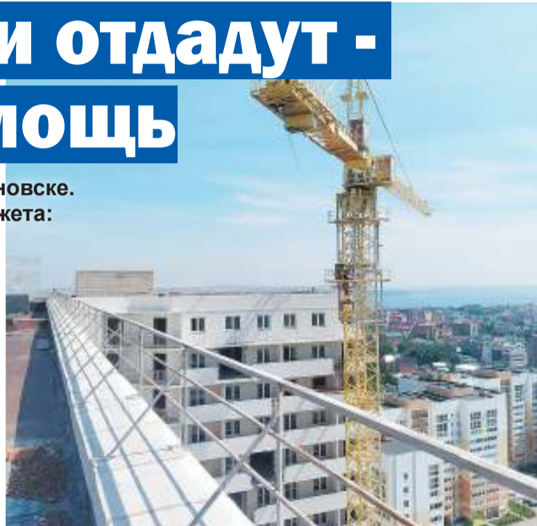
На крыше ЖК «Молодежный» - люди ждут обещанные здесь квартиры уже более 10 лет

Для получения помощи можно обращаться на телефон горячей линии регионального оператора социальной защиты: 48-08-56.