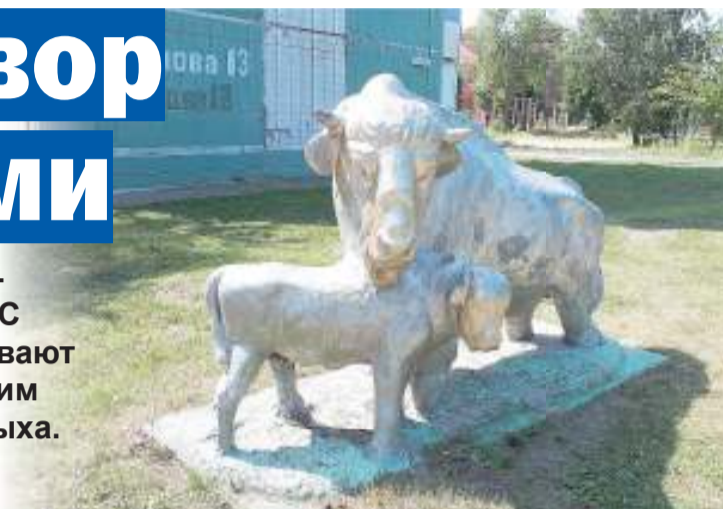
Визитная карточка дома №13 по ул. Нахимова

Раньше жители все делали своими руками и полагались только на свои силы, но когда появились различные программы с бюджетным финансированием, дело пошло еще веселее. Первые преобразования во дворе произошли еще два года назад. Тогда начали