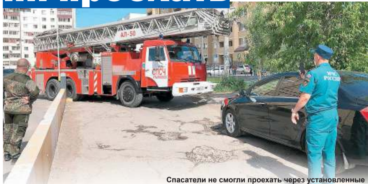
Спасатели не смогли проехать через установленные шлагбаумы и преграды - их владельцам будут выданы предписания о демонтаже

Очень хорошо, когда у каждого участка земли есть свой хозяин, - это значит, что есть кому заботиться о благоустройстве и чистоте. Но бывает, когда так хорошо, что уже плохо... Жители дома №44 по проспекту Тюленева столкнулись с тем, что спецтехника (не только мусоровозы, но и пожарные машины) не может проехать к их МКД из-за того, что все проезды кругом перегорожены собственниками.