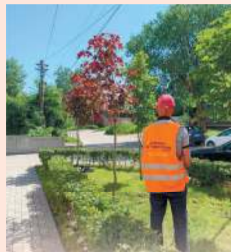
Для ухода за придомовой территорией у каждого дома - свой персонал