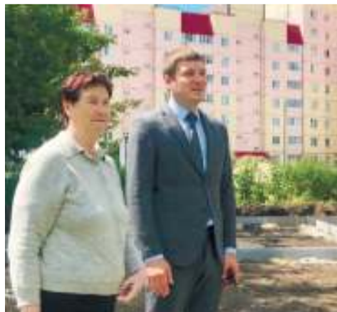
Сейчас собственники МКД вместе с депутатом контролируют ход работ

- По просьбе жителей было подготовлено постановление, и данный земельный участок тогда был зарезервирован для муниципальных нужд. Таким образом мы пресекли застройку и посягательства коммерческих структур на данную территорию, - пояснил председатель Ульяновской Городской Думы Илья НОЖЕЧКИН .