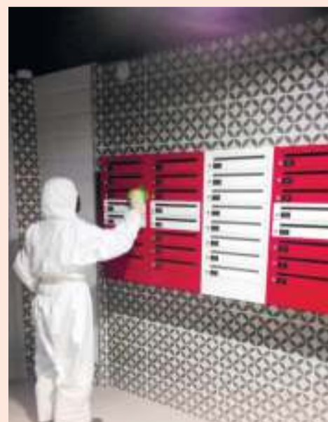
Дезинфекция поверхностей в подъезде - ежедневно