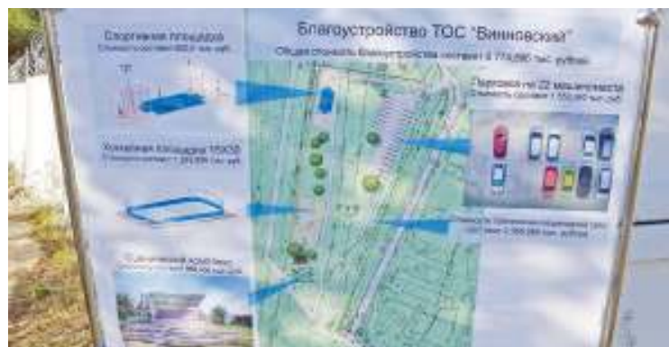
Запланировано много, но ничего лишнего