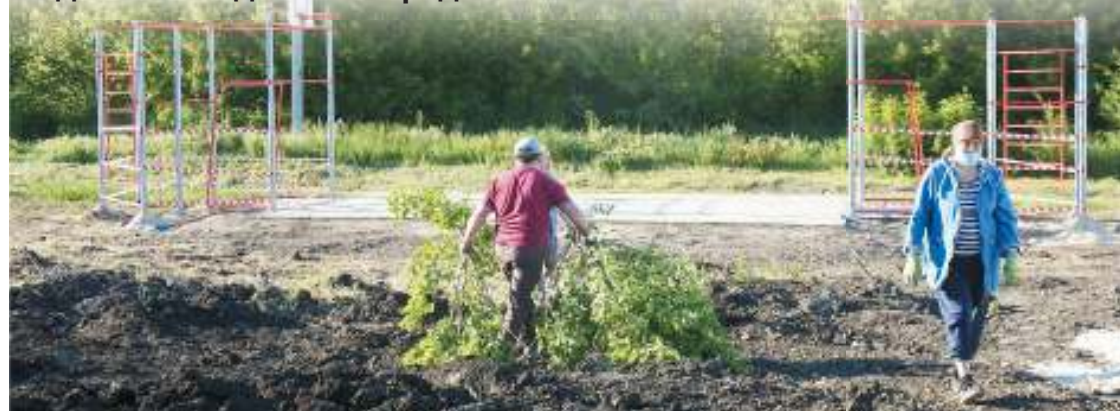
Ландшафт сложный, для выравнивания места под спортплощадку требуется много стройматериалов и усилий, но местные жители настроены решительно: сообща и горы свернем!

Яркий пример того, как активная жизненная позиция побеждает копившиеся годами равнодушие и апатию. Буквально на глазах заброшенный и заросший пустырь на окраине Железнодорожного района из несанкционированной свалки превращается в зону спорта и отдыха. Инициативу жителей поддержали власти, на благоустройство выделены бюджетные средства.