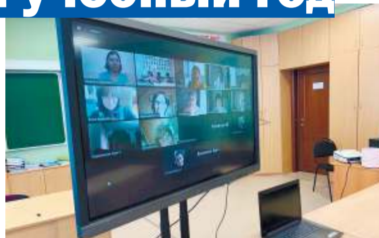
Педсовет в условиях коронавируса выглядит так

С этого месяца для младших школьников, находящихся дома, стартует проект «Онлайн-каникулы». Вместе с родителями дети