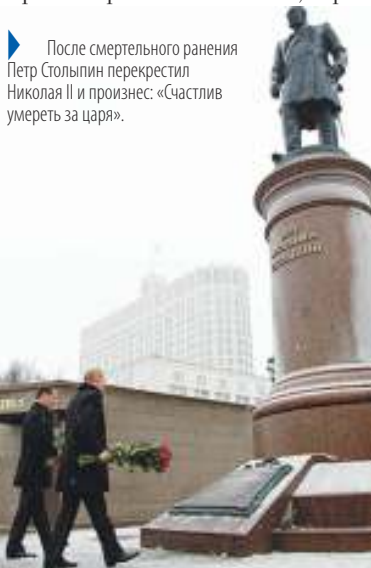
После смертельного ранения Петр Столыпин перекрестил Николая II и произнес: «Счастливы умереть за царя».

Сегодня вновь хочу сказать: Россия у нас одна. И все мы, каких бы разных взглядов и позиций ни придерживались, должны беречь и защищать ее, во главу угла ставить будущее нашего народа, счастье наших людей, наших детей и внуков.