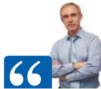
Сергей Морозов, губернатор Ульяновской области

- Эти средства являются очень хорошим подспорьем для проведения зрелой социальной политики. Кстати, напоминая, что эти средства были направлены на повышение зарплат, ремонт и гранты школам, модернизацию ЖКХ, социальные выплаты ветеранам