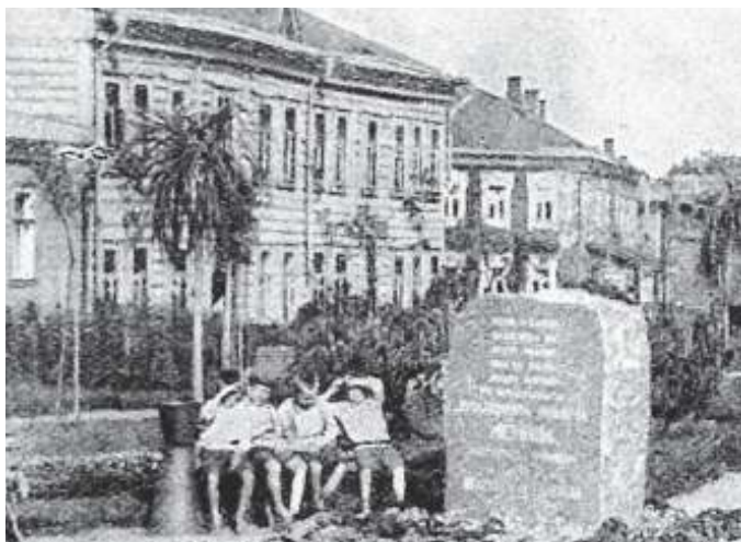
Памятный камень и сквер на месте покушения. 1923 год.