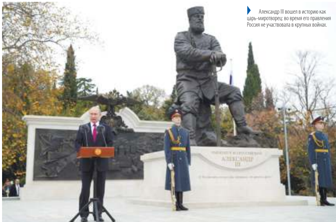
Александр III вошел в историю как царь-мироотворец: во время его правления Россия не участвовала в крупных войнах.

Президент перечислил сильные стороны правления императора: бурное промышленное развитие страны, прогрессивное для того времени трудовое законодательство, строительство Транссибирской магистрали. Отдельно подчеркнул, что при Александре III