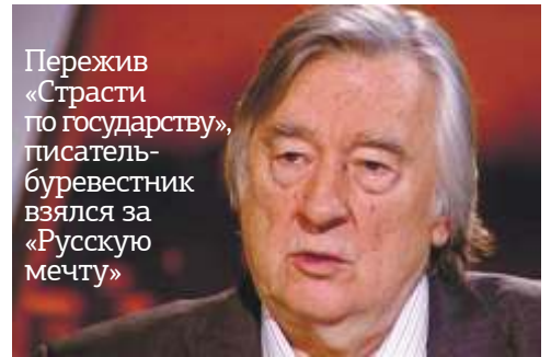
Пережив «Страсти по государству», писатель-буревестник взялся за «Русскую мечту»

Да, на месте предприятия, вошедшего в книги, живописные полотна, фильмы, поднимется квартал с квартирами, офисами и ландшафтным дизайном. Хорошо, что будут сохранены памятник заводчанам, погибшим в Великую Отечественную и в Афганистане. Хорошо, что не снесут статую Ленина и камень - памятный знак на месте, где вождя пытались убить. Все это - наша память. И совсем не инсценировка.