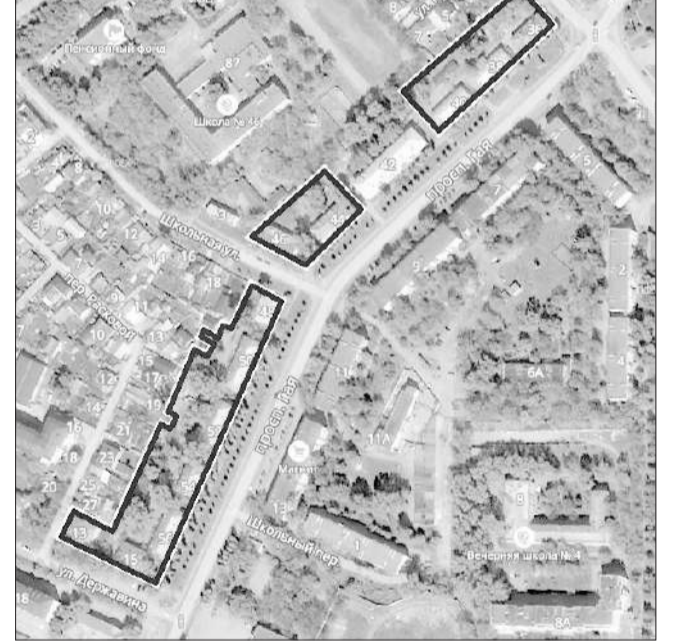
Схема расположения границ подлежащей развитию застроенной территории в границах проспекта Гая, улицы Державина в Железнодорожном районе г. Ульяновска, площадью 1,74 га

С.С. Панчин Глава города ПРИЛОЖЕНИЕ №1 к постановлению администрации города Ульяновска от 03.08.2018 №1471