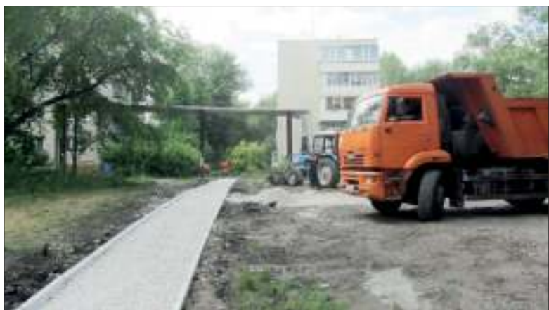
Работы были выполнены очень быстро, сейчас долгожданная тропинка уже заасфальтирована, более того - по просьбе жителей попутно были проложены и еще несколько дорожек

- В 2012 году я сюда вселилась, можно сказать, неосмотрительно. Сначала не обратила внимания на состояние дома и двора. Но уже через две недели все про-