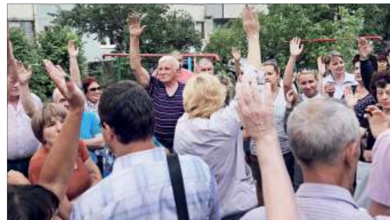
На сходах граждан принимаются решения о внесении изменений в проект - жители дома №18 по ул. Отрадной, например, проголосовали за дополнительное ограждение детской площадки и строительство заездного кармана на 20 автомобилей

В этом году в федеральный проект вошли 17 дворов, некоторые из них включают сразу несколько огромных МКД с большим количеством жителей. Кроме того, в данную программу вошли три общественные территории: сквер по улице Камышинской, парки - Дружбы Народов и «Прибрежный». Еще 10 общественных пространств будут приводиться в порядок по двухлетним контрактам (в течение этого и следующего годов).