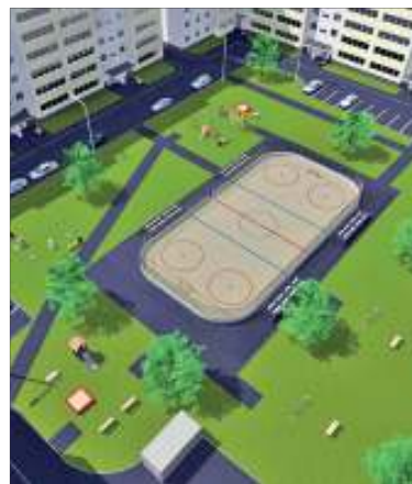
Так, по мнению проектировщиков, будет выглядеть двор по адресу: ул. Рябикова, 77 после благоустройства

- Мы уже несколько раз проводили сходы граждан во дворах, где сейчас идут ремонтные работы, обсуждали. У людей были замечания вначале к подрядчикам. Но сейчас все недочеты уже устранены благодаря пристальному вниманию Главы города, который очень трепетно относится к мнению горожан, выслушивает их и оперативно принимает необходимые меры. Поэтому