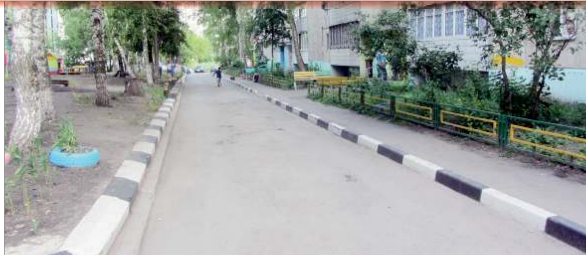
От заезда автомобилей на газоны во дворе дома №76 по ул. Отрадной придумали простой, но эффективный способ - установили высокий бордюр

- Менять УК не стали, несмотря на первоначальные трения. Да что вы! У нас сейчас вообще