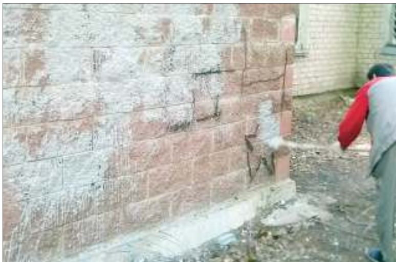
В Заволжье силами администрации района закрашиваются надписи с рекламой незаконных наркотических средств на стенах МКД, при этом, конечно, страдает внешний вид фасада

Согласно ч. 11 ст. 5 Федерального закона «О рекламе», при производстве, размещении и