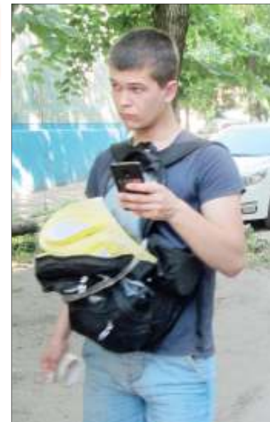
Этого парня с кипой объявлений, которые он наклеивал на все, - двери, стены, столбы, - наш журналист сфотографировал прямо во время проведения мастер-класса для старших по домам города Ульяновска, при этом ни один из них даже не сделал замечание и уж тем паче не попробовал остановить или помешать совершать нарушение

Так или иначе, это по-прежнему остается большой проблемой для многих МКД в нашем городе. Тратятся средства и силы на устранение последствий расклеивания несанкционированной рекламы на доме, и пока невозможно найти никакой управы на эту незаконную деятельность. Повсеместное оснащение дворов видеонаблюдением тоже не принесит особых плодов. Возможно, еще и потому, что отношение самих собственников к своему общему имуществу зачастую не отличается образцовым порядком. Соответственно, и к нарушениям со стороны расклейщиков объявлений жильцы относятся по-прежнему.