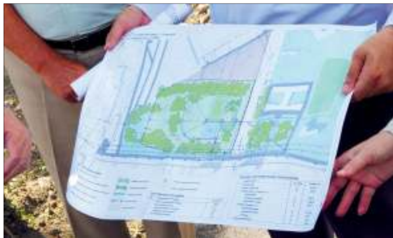
Глава администрации Засвияжского района представил предварительный проект благоустройства сквера - реализация его начнется только после обсуждения с жителями