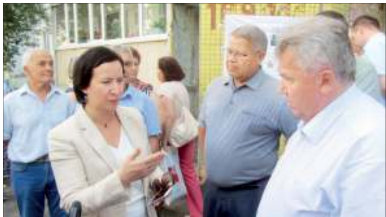
Депутат Алсу САДРЕТДИНОВА передала Главе города Сергею ПАНЧИНУ предложения жителей по дальнейшему развитию их придомовой территории

Определены наиболее значимые и интересные предложения от жителей Ульяновска, которые будут реализованы в следующем году. По решению бюджетной комиссии было отобрано девять проектов, которые получат финансирование из бюджета города на общую сумму 30 млн рублей.