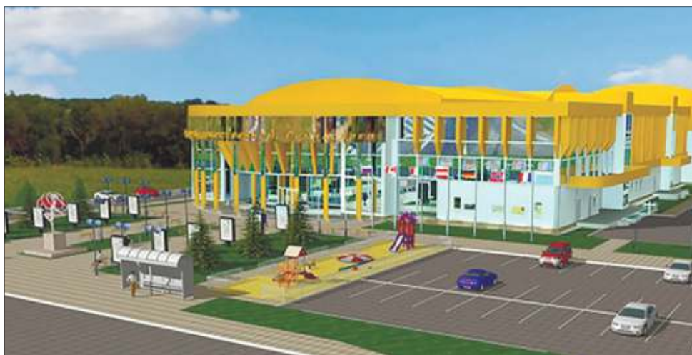
Проект будущего грандиозного сооружения

По ее словам, значительный объем средств будет выделен именно на стро-