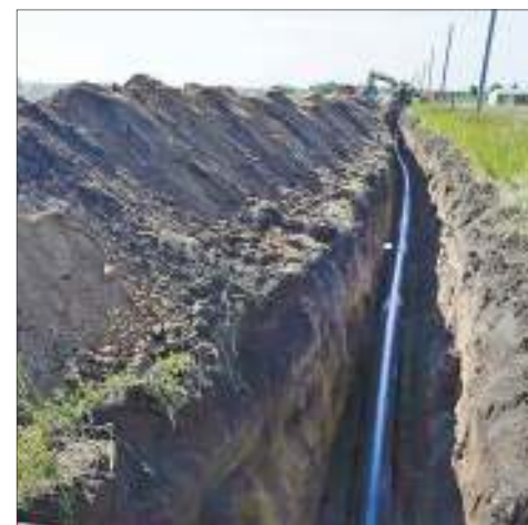
Благодаря строительству водопровода более 200 участков в Заволжском районе получат постоянный доступ к воде

Ранее на встрече с руководством области и города многодетные обратились с просьбой об установке детских игровых комплексов. Сегодня они уже действуют.