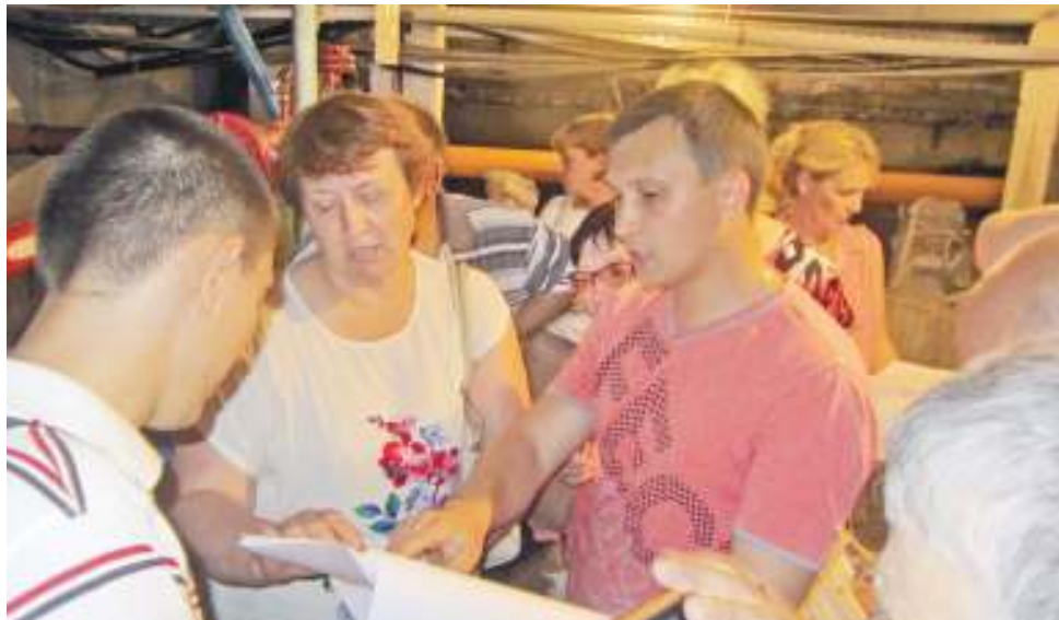
Участники мастер-класса дотошно изучали каждую строчку в журнале осмотра МКД и сравнивали с тем, что видят вокруг