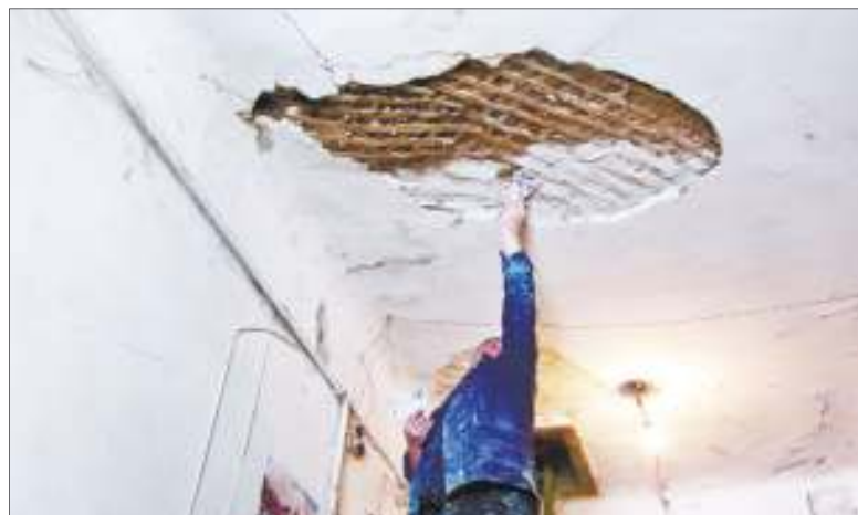
В подъезде дома №21 по ул. Герасимова после капремонта кровли обвалился потолок из-за того, что в контракте забыли прописать работы по герметизации крыши, и подрядчик их не сделал

ни от подрядчиков, ни от контролирующего их регионального оператора. Отчаявшись, жители обратились в ОНФ. Активисты Народного фронта несколько раз выезжали на место, привлекали внимание общественности и ответственных лиц. Изначально