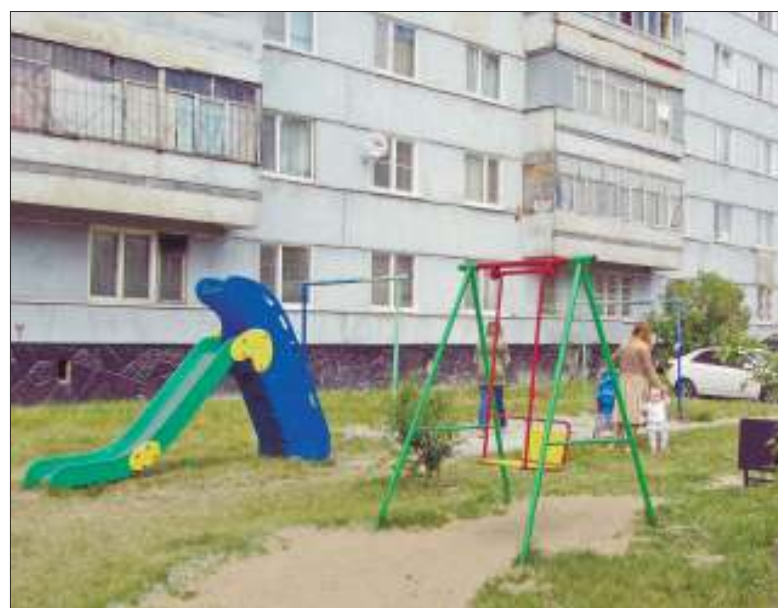
Детскую площадку возле дома на ул. Пожарского, 6 на собственные средства приобрел жилец дома - предприниматель, который также вкладывает свои деньги то в ремонт отмостки, то еще на какие-то дорогостоящие работы, на которые у остальных собственников не хватает средств