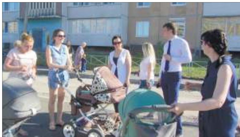
Мамочки с колясками возле ул. Камышинской, 6, где ведутся ремонтные работы, поблагодарили депутатов, что благоустройство начали именно с тротуаров - есть где гулять с детьми