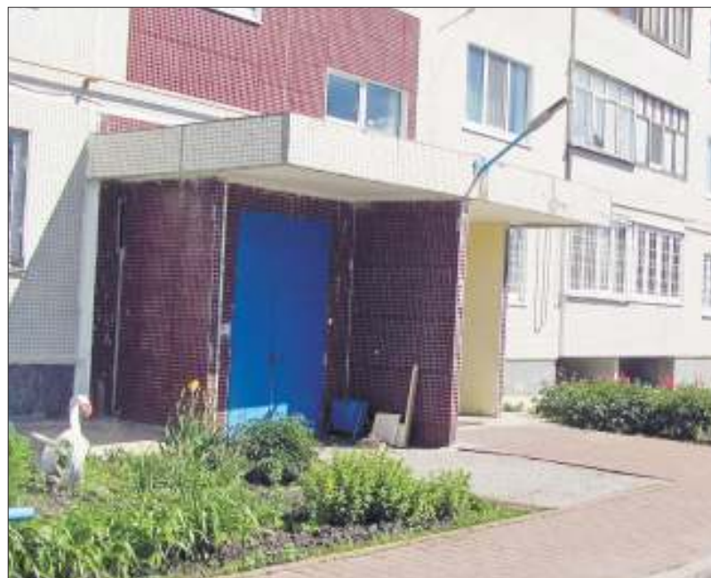
Дом и двор на ул. Верхнеполевая, 2А - работа не только УК, но и самих жильцов, которые здесь высаживают цветы и ухаживают за ними

- Конечно, доверие очень важно между собственниками и УК, но и контроль нужен. У нас жильцы и на крышу сами поднимались, и в подвал спускались, смотрели, как идут работы, проверяли. Сначала беспокоились, все-таки столько заплатили, но теперь довольны. Мы раньше такого комфорта в своем