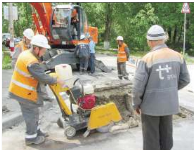
Большинство работ по устранению слабых мест на тепловых сетях в Ульяновске сопровождалось вскрытием дорожного полотна и раскопкой грунта

По вопросам восстановления качества подачи ГВС, а также ее качества жители Ульяновска могут звонить по телефону диспетчерской службы «Т Плюс» 456-888 .