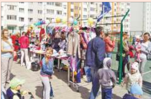
Общие мероприятия помогают жителям познакомиться и сплотиться, что очень важно для собственников при управлении общим имуществом

- Именно здесь впервые в регионе, при поддержке Губернатора Сергея МОРОЗОВА , в 2016 году, на тот момент главным врачом нашей больницы Рашидом АБДУЛЛОВЫМ (ныне министром здравоохранения Ульяновской области), был реализован проект учреждения совершенно