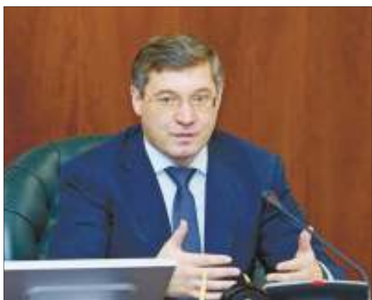
Владимир ЯКУШЕВ считается соратником мэра Москвы Сергея СОБЯНИНА , которого сменил на посту Губернатора Тюменской области, когда того перевели главой Администрации Президента РФ