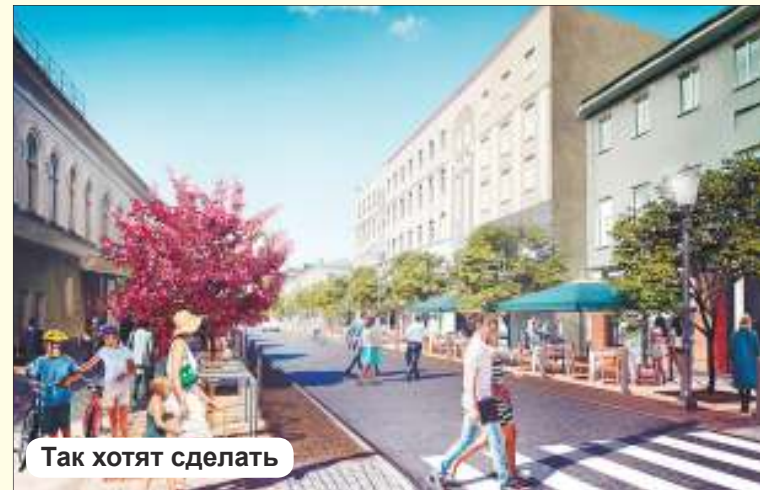
Так хотят сделать

После завершения земляных работ «Ульяновскводоканалом» начнется ремонт проезжей части улицы Федерации по федеральному проекту «Безопасные и качественные дороги».