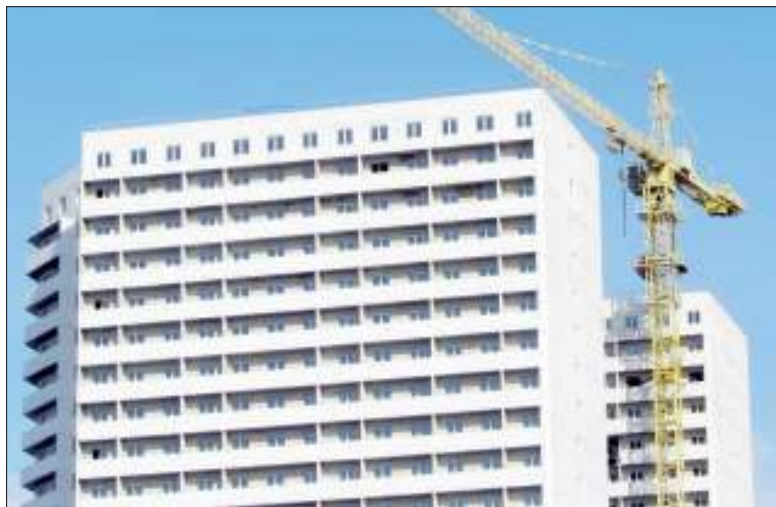
Ежегодно 10% семей должны иметь возможность улучшать свои жилищные условия