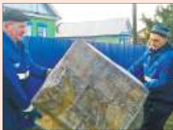
Хлам не только вывозили бесплатно, но и помогали выносить из дома