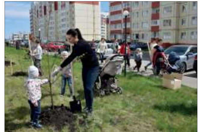
В микрорайонах новостроек заложили основу зеленого фонда - высадили именные деревья, за которыми теперь будут ухаживать всей семьей