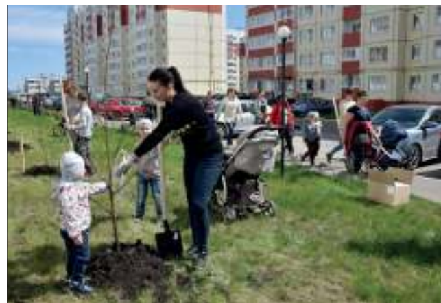
В микрорайонах новостроек заложили основу зеленого фонда - высадили именные деревья, за которыми теперь будут ухаживать всей семьей