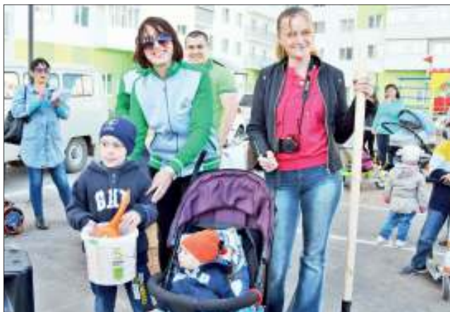
Отличная замена обычному субботнику - семейные праздники во дворе, с озеленением, благоустройством и одновременно с отдыхом, конкурсами, призами и просто душевным общением с соседями