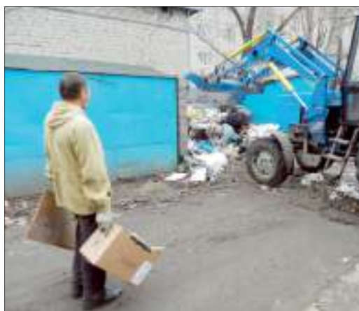
Прямо во время ликвидации свалки во дворе появился мужчина, направлявшийся к куче мусора. Нарушителя можно было буквально поймать за руку, однако что с ним делать дальше и как привлечь к ответственности - неизвестно

что они сами захлывают свой двор, будет категорически неверно! Дело в том, что хотя коммерческие организации и прекратили оплачивать контейнеры, отходов у них от этого не убавилось, и они также продолжают их бросать в общую кучу. Мусор от жителей и от предпринимателей легко отличить по составу, причем его сразу заметно. В МКД на ул. Минаева, 22 размещаются и магазин, и кафе, а в соседнем доме - банк.