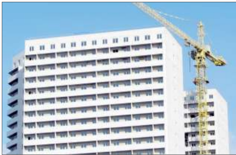
Ежегодно 10% семей должны иметь возможность улучшать свои жилищные условия