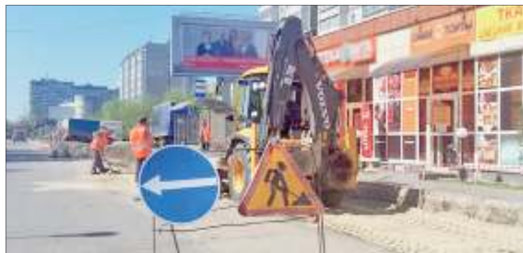
После завершения ремонтной кампании этого года 55,5% автодорог города будут приведены в нормативное состояние. Для сравнения: по итогам 2017 года было почти 50%, 2016 года - менее 45%