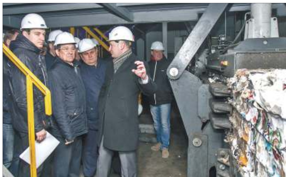
Депутаты, общественники и представители муниципальной власти познакомились с процессом сортировки ТКО для вторичного использования

- В настоящее время существует ряд проблем. Например, изменяется единица измерения данной услуги - вместо квадратных метров будут платить в зависимости от количества проживающих. Поэтому для тех граждан, у которых размер площади на человека меньше среднего, принятого раньше для расчета в составе платы за содержание