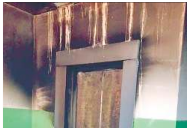
Так лифт выглядел после пожара, запах гари сохранялся в подъезде буквально до последнего времени - вплоть до проведения ремонта

Бригада строителей полностью заменила все оборудование и кабину подъемника, что обошлось в 1,853 млн рублей. Но с жителей дополнительных платежей не собирали - все сделали за счет капремонта