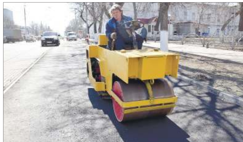
Весь карточный ремонт в Ульяновске планируют завершить до конца мая

по сбору и вывозу дорожного смета состоят из грейдера, тракторов, погрузчика и самосвалов. Кроме того, используются спецтехника для прочистки ливневой канализации, для отмывки дорожных знаков, ограждений, бордюров, остановочных павильонов, светофоров и пеше-