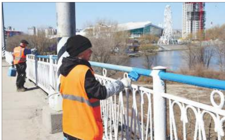
Город преобразуется стараниями сотрудников МУПов