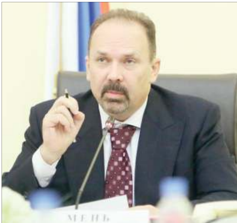
На всероссийском совещании с регионами глава Минстроя России Михаил МЕНЬ рассказал, что реализация закона о прямых договорах подразумевает возможность исключения управляющих организаций из цепочки платежей за коммунальные услуги, что позволит сократить размер задолженности в сфере ЖКХ

Помимо добровольного заключения прямых договоров, закон теперь разрешает сделать это принудительно в случае, если судом зафиксирована задолженность УК перед ресурсоснабжающей организацией в размере,