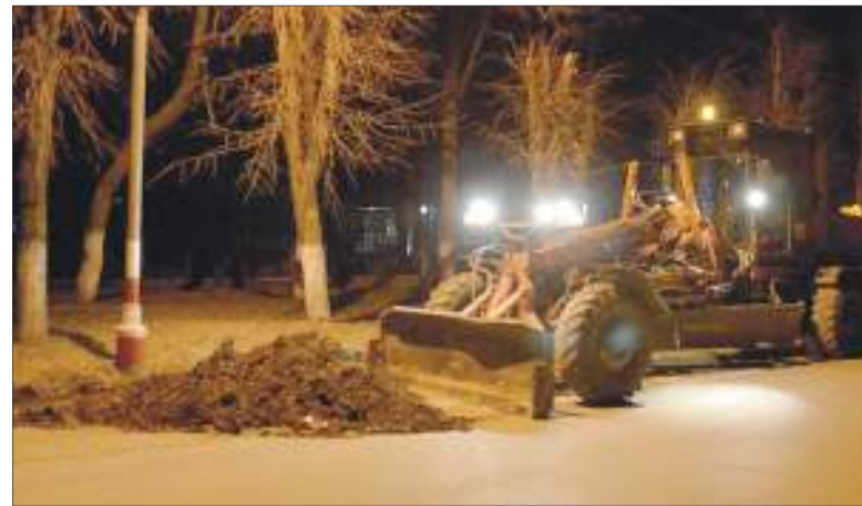
Спецтехника и бригады работают не только днем, но и ночью: идет ремонт дорог и уборка улиц

неделю с применением горячего асфальта ремонт уже прошел на площади более 1000 кв. м, а также с применением литого асфальтобетона - 240 кв. м.