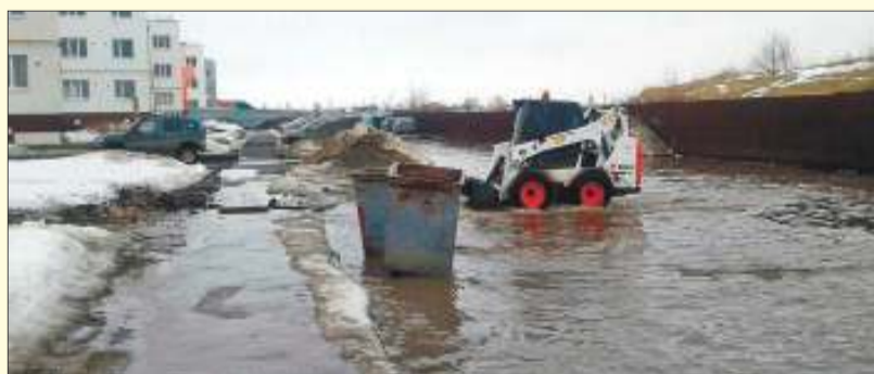
В данный момент основная трудность - сильные затопления дворовых проездов, с чем сейчас борются при помощи спецтехники управляющие компании города

ление. Так, в апреле-мае хотят посадить 1127 деревьев и 1797 кустарников, спилить 107 аварийно опасных и засохших деревьев. Кроме того, предстоит установить 101 скамейку и садовый диван, 104 урны, обустроить на территории города 773 клумбы, посадить цветники и газоны.