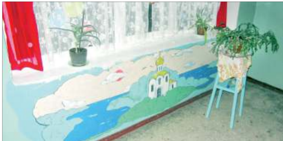
Видно, что подъезд не новый, но зато какой уютный

- Беспорядок и грязь, стены запущенного вида - все это чрезвычайно угнетает. Поэтому начала я с того, что элементарно постаралась навести чистоту в подъезде, - рассказывает Раиса БОГОЛЮБОВА. - Затем решила придать своему подъезду индивидуальность: сшила занавески на окна, разрисовала вход. Жители у нас замечательные, увидели это все и поддержали меня, попросили и дальше украшать. Стала стены разрисовывать. Конечно, окружение очень влияет на человека. Понимаете, когда вокруг царит красота, не хочется и злиться, ругаться. Люди дружелюбнее относятся