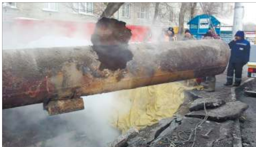
Износ тепловых сетей в Ульяновске (по официальным данным) составляет 62%, или 700 км трубопроводов, которые имеют срок службы более 20 лет

«Организация нарушила обязанность по соблюдению температурного графика