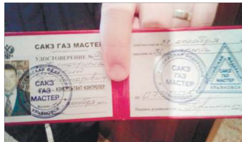
Жительница успела сфотографировать удостоверение, которое предъявляли псевдопроверяющие, - указанной организации, конечно же, в официальном реестре не оказалось

- Договорная работа на техобслуживание внутридомового и внутриквартирного газового оборудования в Ульяновске ведется организациями «Газпром газораспределение Ульяновск» и ООО «Газсервис», - сообщил начальник