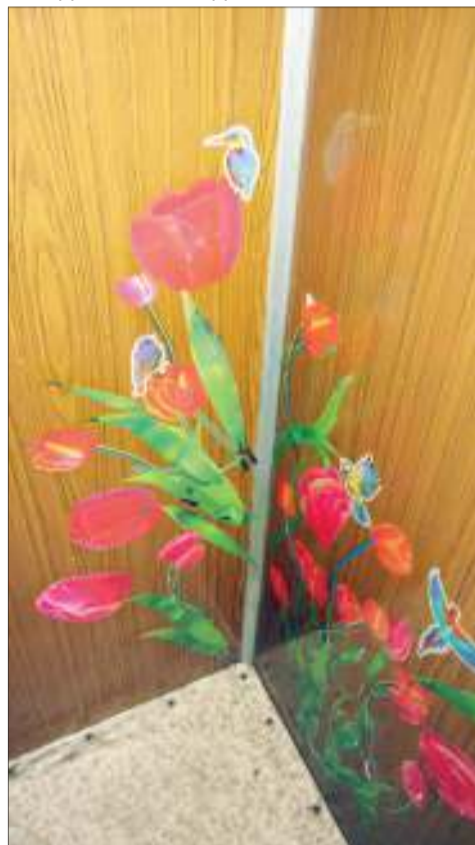
Вот так при помощи декора и дизайна борются с вандализмом в кабинке лифта

Дмитрий МЕДВЕДЕВ подписал постановление Правительства РФ от 27 марта 2018 года №331, которым утверждены новые стандарты сервиса управляющих организаций.