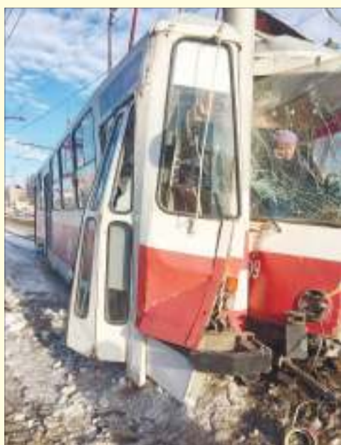
Самым крупным ДТП за последнее время стало столкновение со столбом 14 марта маршрута №6 на Камышинской: трое пострадавших были госпитализированы, четверо доставлены в травмпункт