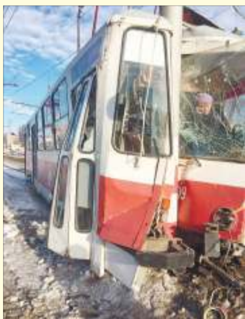
Самым крупным ДТП за последнее время стало столкновение со столбом 14 марта маршрута №6 на Камышинской: трое пострадавших были госпитализированы, четверо доставлены в травмпункт