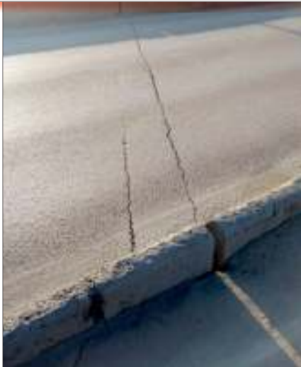
Еще в начале января жители сообщили в соцсетях, что появились трещины на мосту через Свягу по ул. Минаева

По итогам совещания было решено начать с проведения технического обследования всех этих объектов. Затем станет понятно, сколько денег требуется на их ремонт и восстановление. И уже с этими цифрами и данными депутаты намерены вернуться к этому вопросу на очередном совещании, чтобы принять решение об источниках