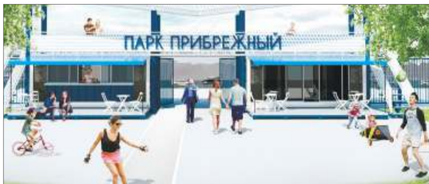
Парк ожидают глобальные перемены - ему отводится роль одной из центральных площадок для отдыха и развлечений жителей всего города

Муниципальная программа «Формирование современной городской среды на 2018-2022 годы», которая принята недавно у нас в городе, включает в себя адресный перечень из 144 дворовых территорий (об отборе которых мы рассказывали ранее) и 30 общественных пространств, которые впервые отбирались путем прямого голосования. Всего на эти цели направят порядка 200 млн. рублей из федерального, областного и городского бюджетов.