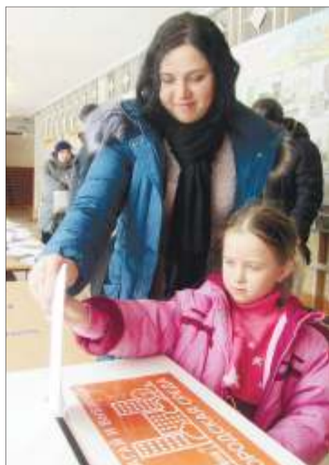
Хотя проголосовать по правилам можно было только с 14 лет, фактически решение принимали семьи вместе с детьми, ради которых в основном и делается данная программа, чтобы им нравилось жить в Ульяновске

По предварительным оценкам, в 2018-2019 годах в Ульяновске планируется благоустроить 13 парков и скверов, в поддержку которых высказалось наибольшее число жителей города. Но пока это не окончательная цифра! Все зависит от того, на какую сумму выйдут сметы проектов-лидеров. Начиная сверху, будут вести отчет стоимости работ, которые ограничены бюджетом програм-