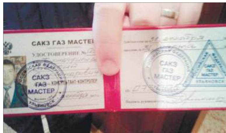
Жительница успела сфотографировать удостоверение, которое предъявляли псевдопроверяющие, - указанной организации, конечно же, в официальном реестре не оказалось

- Договорная работа на техобслуживание внутридомового и внутриквартирного газового оборудования в Ульяновске ведется организациями «Газпром газораспределение Ульяновск» и ООО «Газсервис», - сообщил начальник